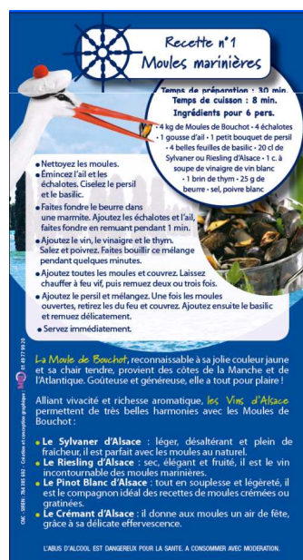
Fiche recette Verso