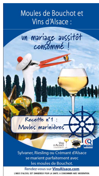
Fiche recette Recto